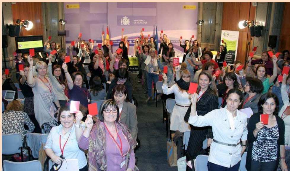
ATAEM en el acto del Lobby Europeo de Mujeres en el Ministerio de Igualdad